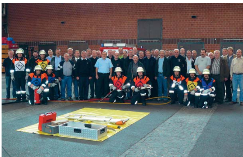
Teilnehmer des Arbeitskreises „Leistungsprüfung“ an der Staatlichen Feuerweherschule Regensburg.

Um eine einheitliche Vorgehensweise sowohl bei der Abnahme sowie bei der Bewertung der Leistungsprüfung zu fördern, wurden